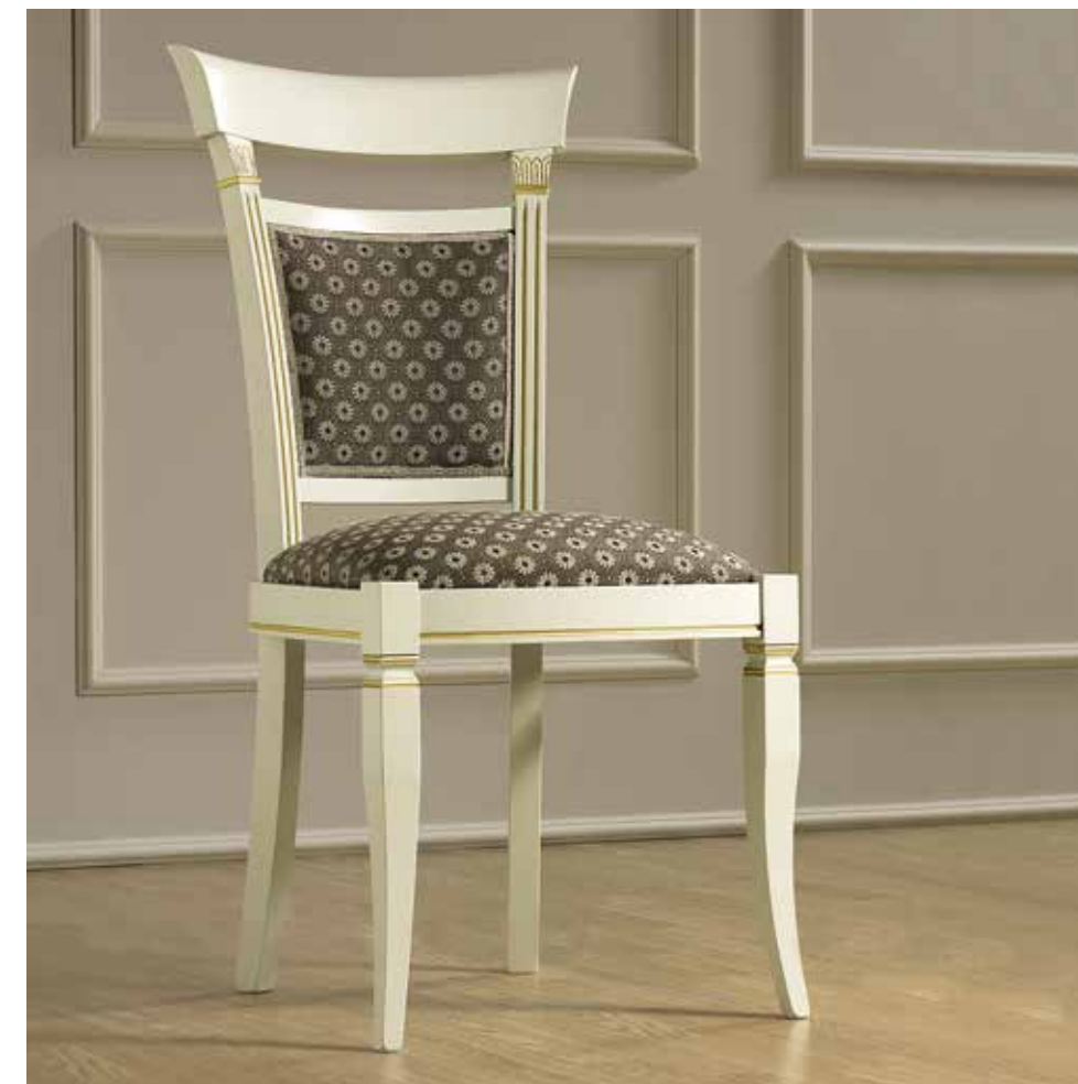
COD. 134SED.01FRMS75 - SATURN 9